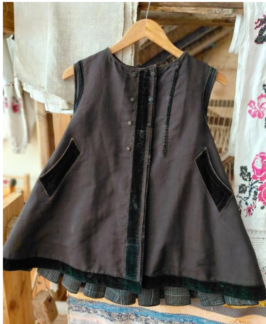
Рис. 1. Жіноча керсетка

У січні 2026 року фонд музею етнографії поповнився новим експонатом – жіночою керсеткою (музейний номер 245), що надійшла до музею шляхом дарування від А. О. Ковшик (рис. 1). Це надходження стало підґрунтям для організації дослідницької діяльності вихованців гуртка.