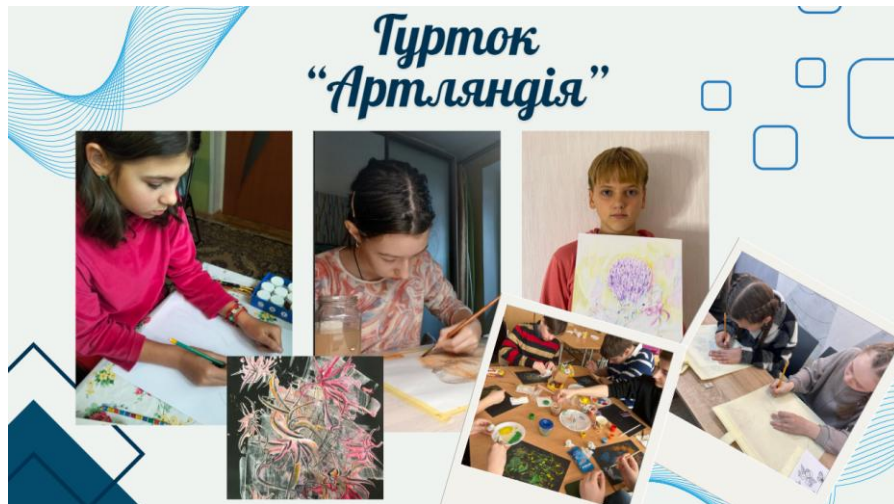
Рис. 1. Заняття учнів ліцею у гуртку «Артляндія»

Організація занять була спрямована на створення безпечного творчого простору, у якому учні могли вільно виражати свої почуття та переживання через художні образи. Значна увага приділялася роботі з кольором як одному з важливих засобів емоційного самовираження. Учні виконували творчі завдання, спрямовані на візуалізацію власного настрою, переживань і внутрішніх ресурсів. Використання технік колажу та артскетчингу сприяло розвитку образного мислення, формуванню позитивних асоціацій і відчуття творчої свободи.