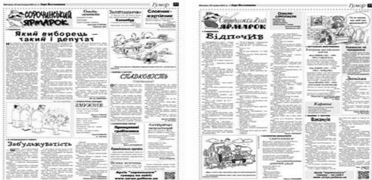
Рис. 1. Тематична сторінка «Зорі Полтавщини» «Сорочинський ярмарок» [1]

– тут друкують авторів не лише полтавських, а й з інших областей; – з-поміж місцевих письменників «Зоря...» найчастіше оприлюднює твори Олексія Домницького, Юрія Кругляка, Валентина Чемериса, Володимира Михайлова;