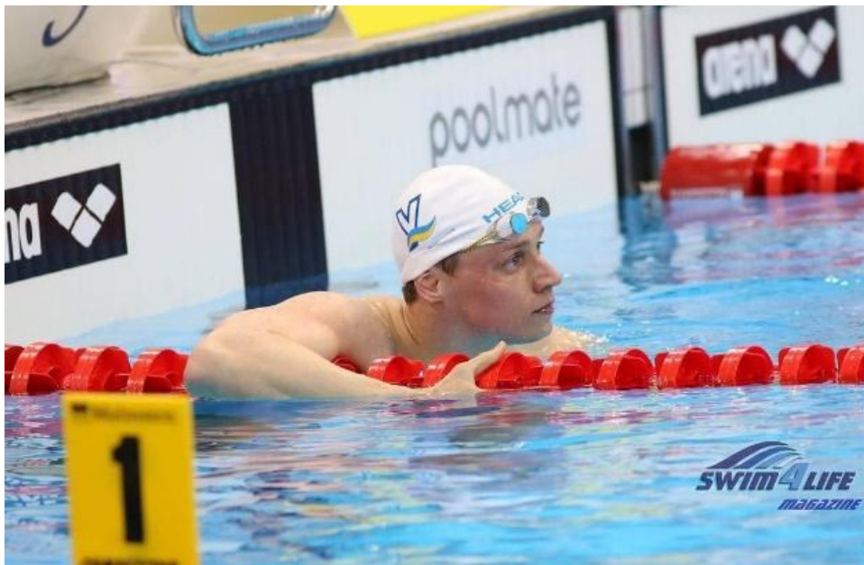
Рис. 2. Учасник 31-х Літніх Олімпійських ігор у Ріо-де-Жанейро